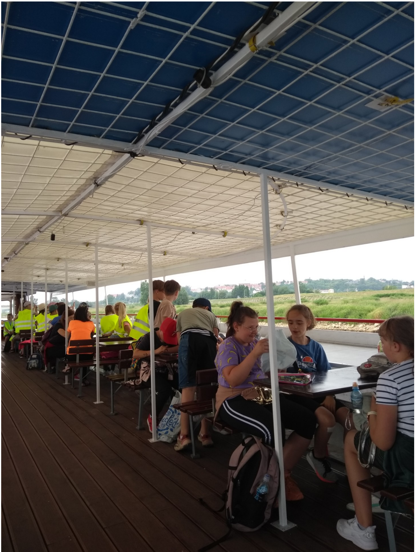
Rejs statkiem po Wiśle.