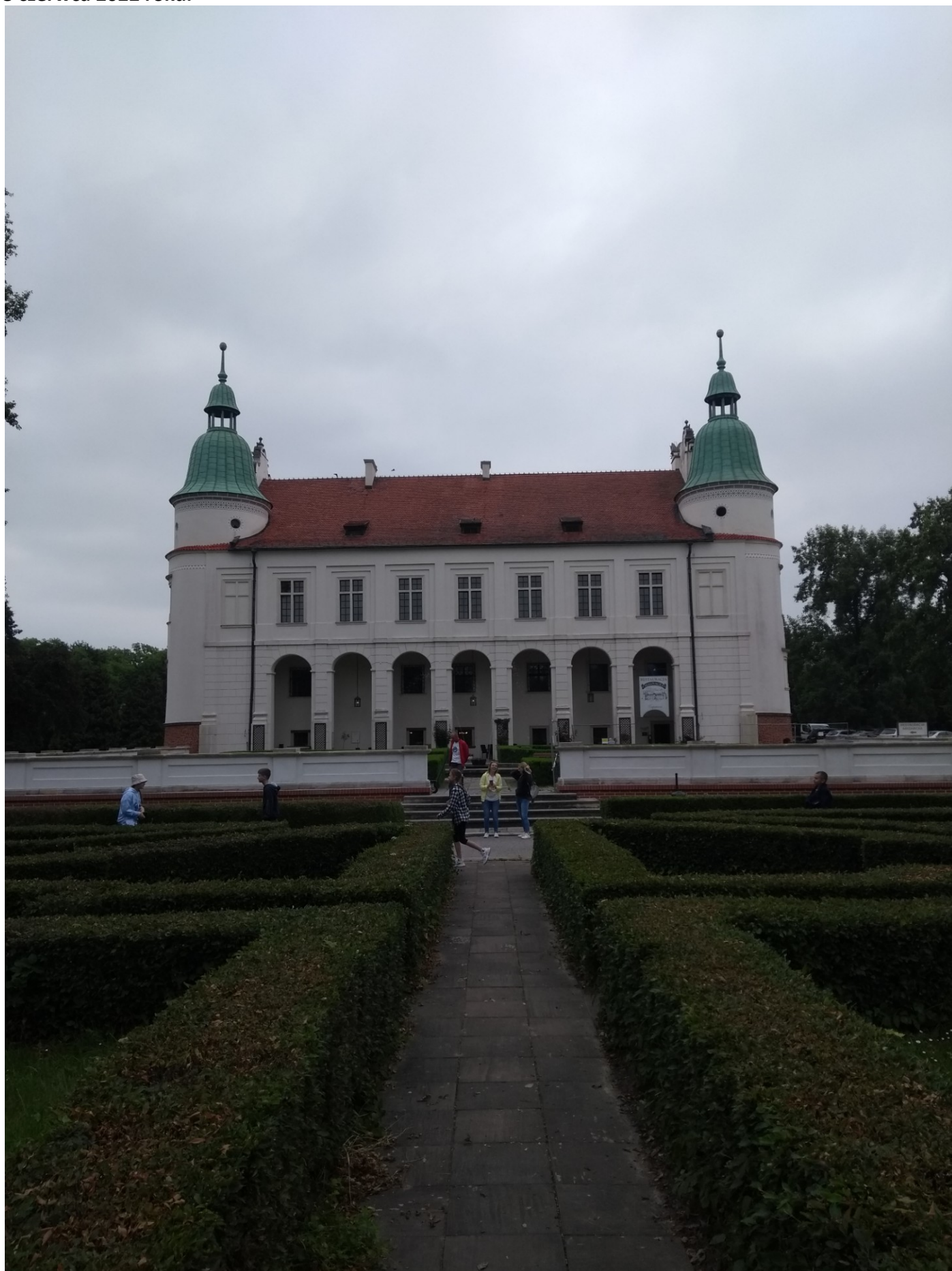
Zamek w Baranowie Sandomierskim zwany Małym Wawelem.