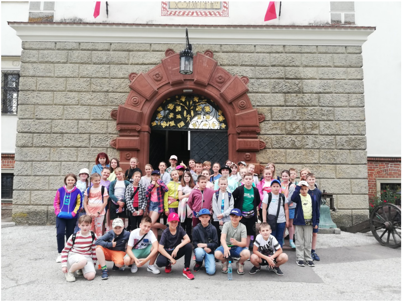
Uczestnicy wycieczki na tle głównej bramy zamkowej.