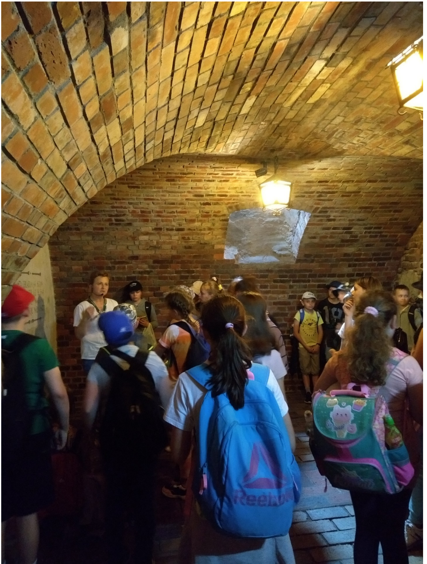
Zwiedzanie Podziemnej Trasy Turystycznej prowadzącej pod sandomierskim rynkiem.