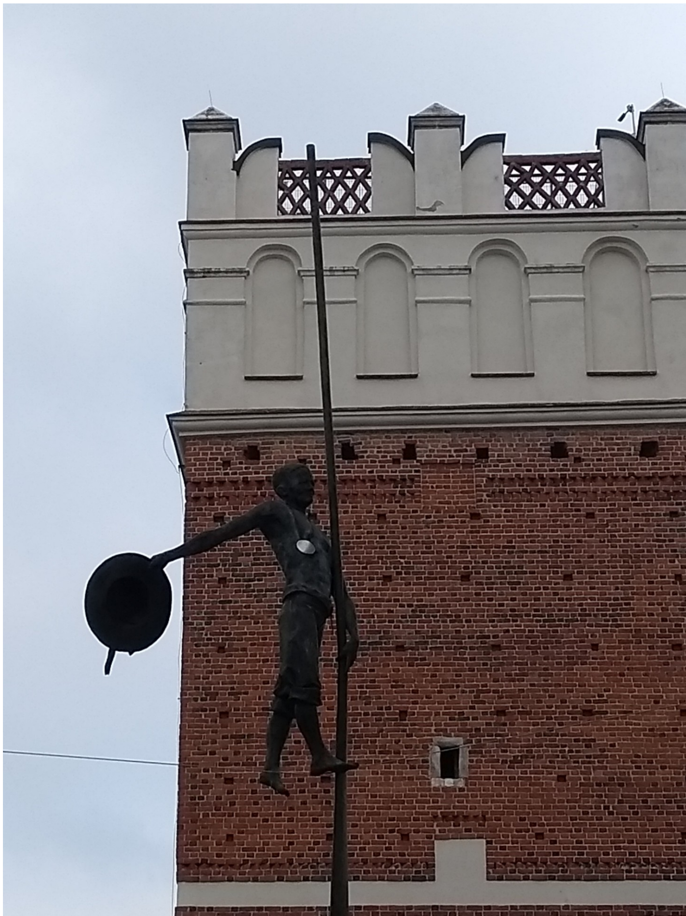
Balansująca w powietrzu rzeźba flisaka nad ulicą Opatowską.