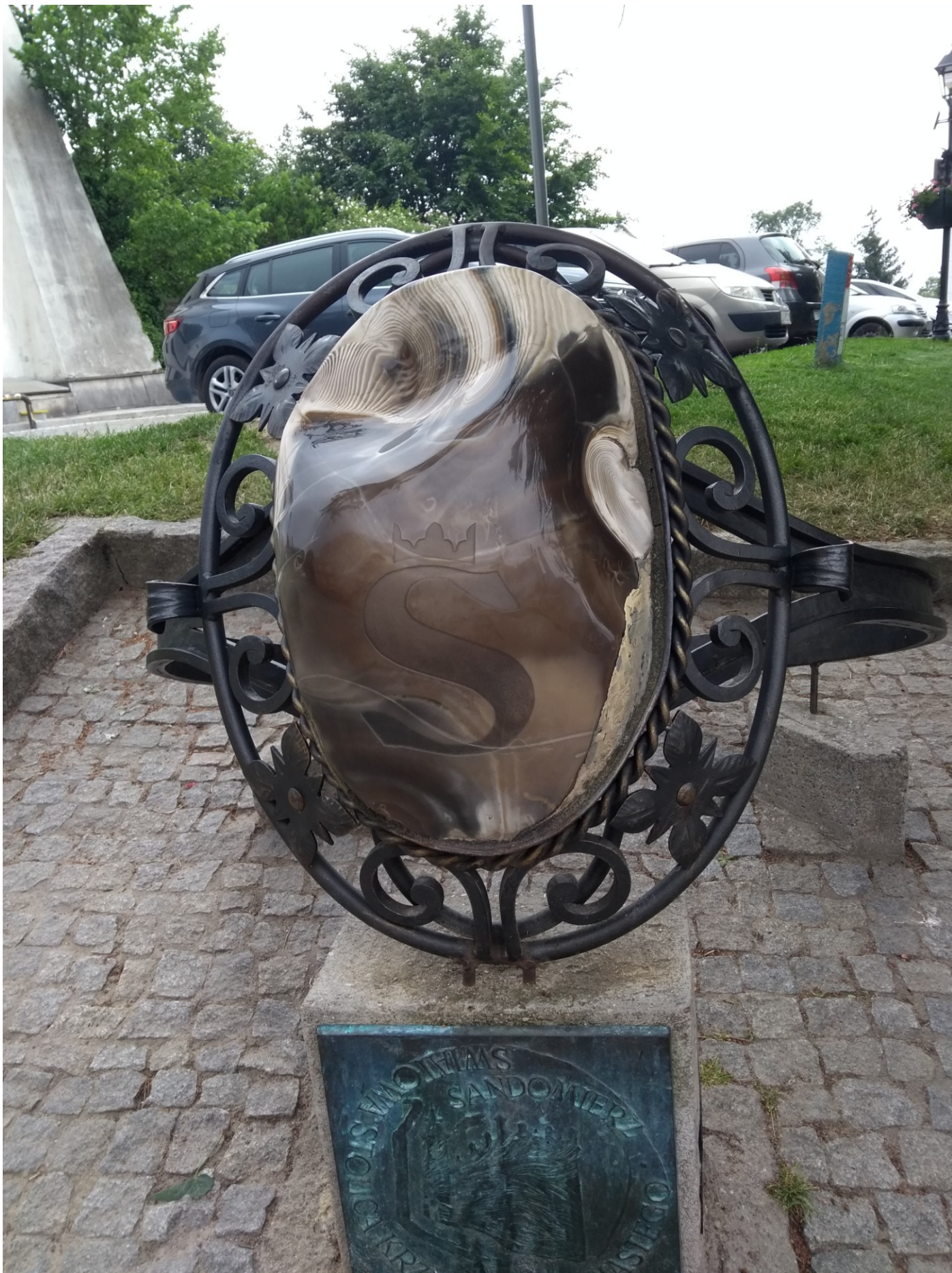
Sandomierska atrakcja – pierścion z krzemienia pasiastego w rozmiarze XXL plus.