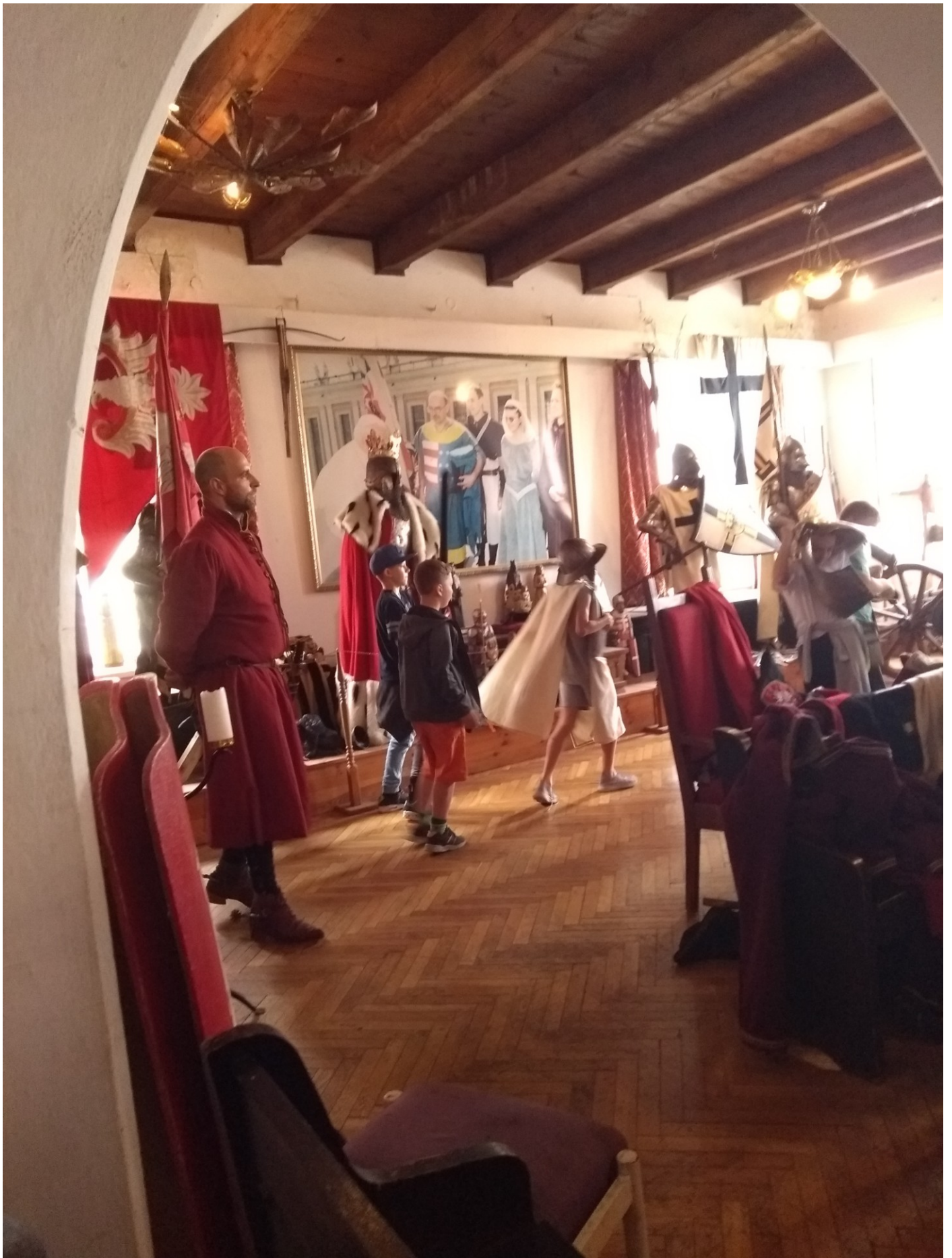
W Zbrojowni Chorągwi Rycerstwa Ziemi Sandomierskiej.