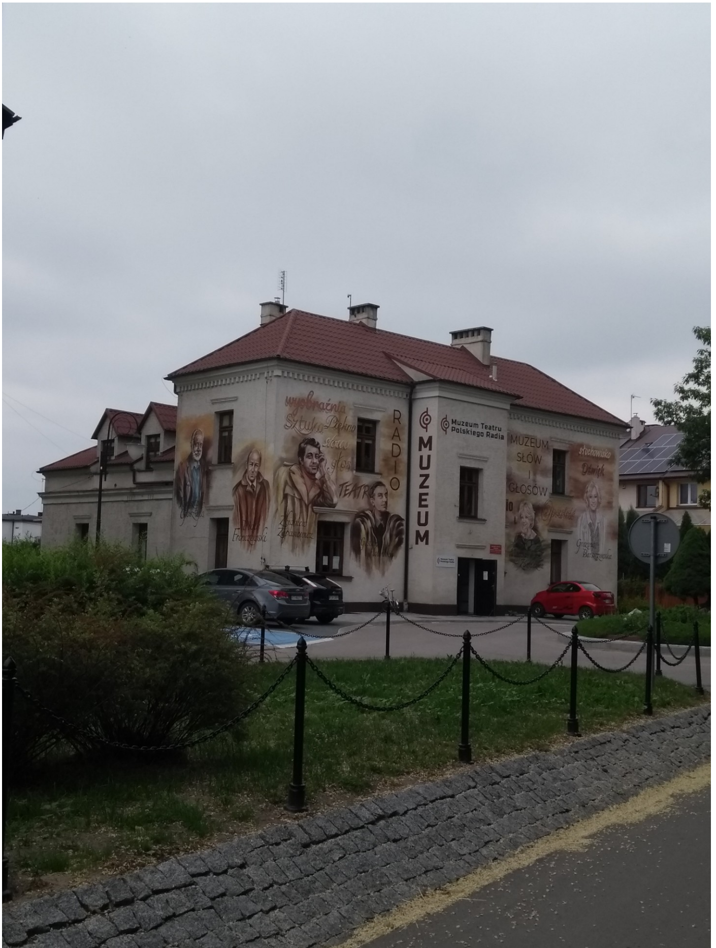
Muzeum Teatru Polskiego Radia w Baranowie Sandomierskim.