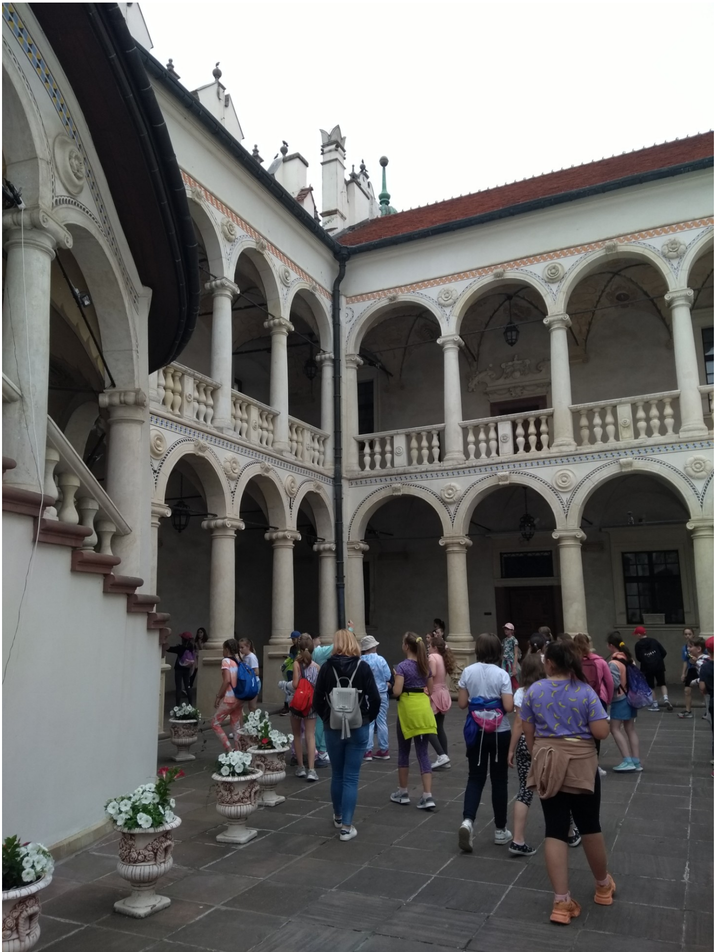
Na dziedzińcu zamkowym.