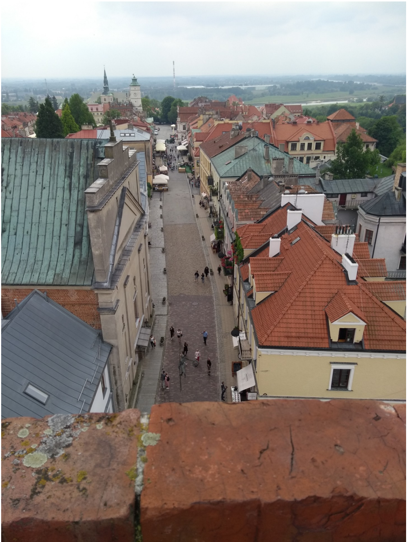
Panorama Sandomierza z Bramy Opatowskiej.