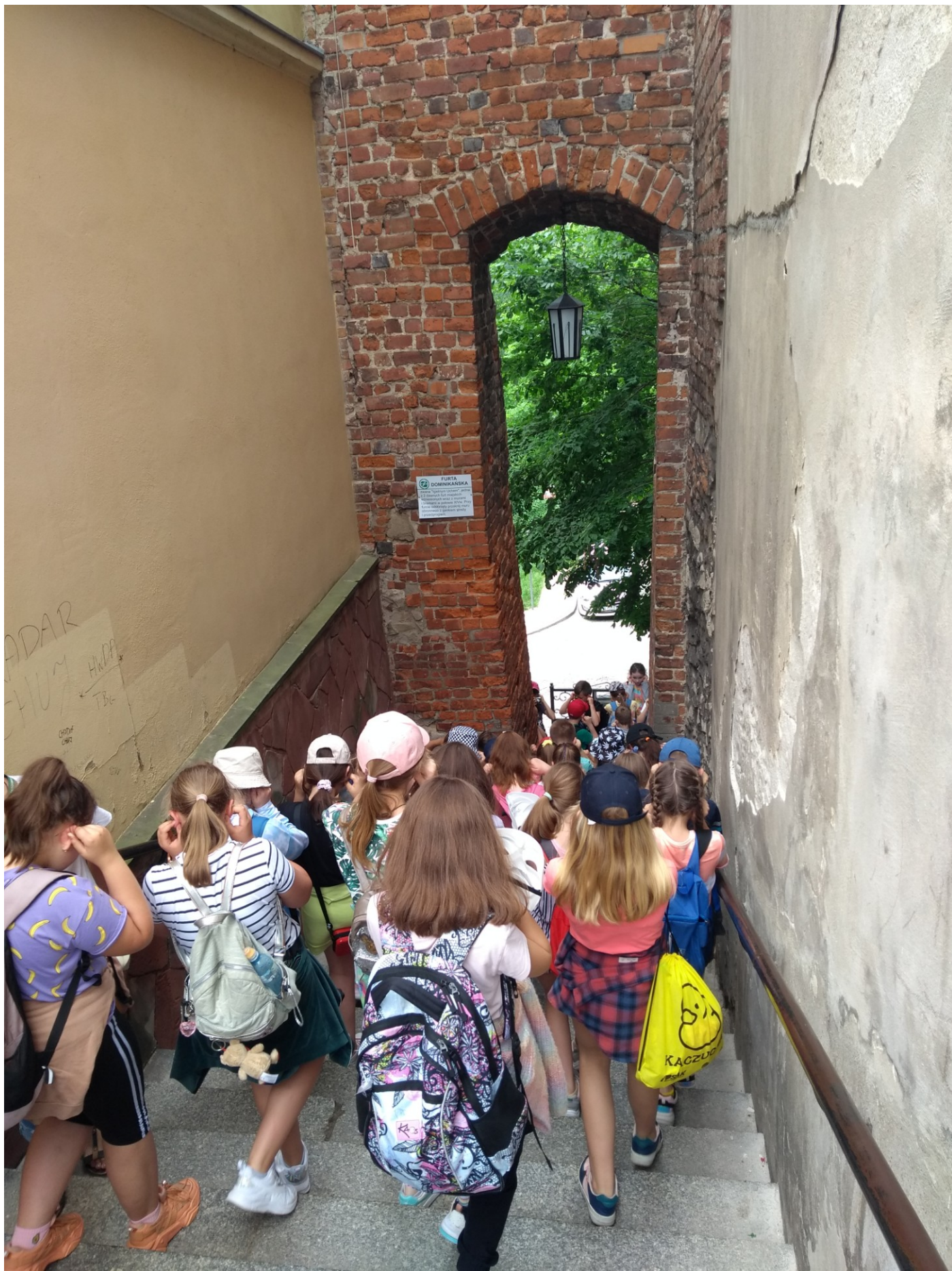
Przejście przez Ucho Igelne – ostatnią istniejącą furtę w murach obronnych Sandomierza.